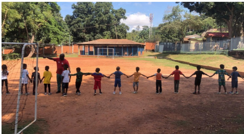
LE SPORT À L'ÉCOLE PRIMAIRE (PAGE 3)