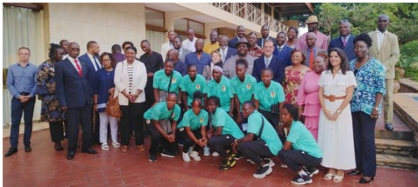
ACCUEIL DES ATHLÈTES CENTRAFRICAINS À LA RESIDENCE DE FRANCE DE BANGUI APRÈS LES JO PARIS 2024 (PAGE 3)