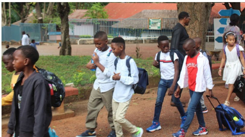
UNE RENTRÉE EN TOUTE SÉRÉNITÉ (PAGE 2)