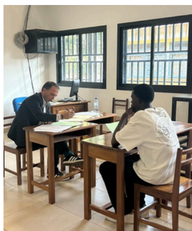
SEMAINE D'EXAMENS AU LFCDG (PAGE 2)