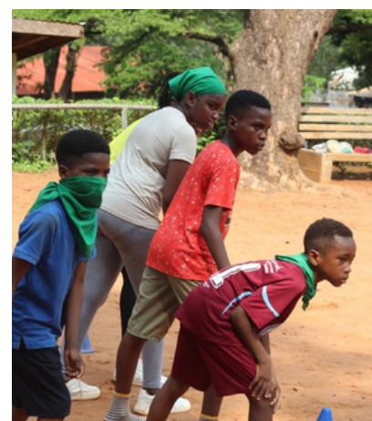
CM1 A : LE DOUBLE DRAPEAU (PAGE 3)