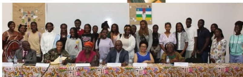
MAI DES LANGUES 2025 (PAGE 2)