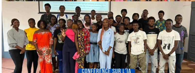
CONFÉRENCE SUR L'IA

36 E ÉDITION DE LA SEMAINE DE LA PRESSE ET DES MÉDIAS AU LFCDG (PAGE 2)