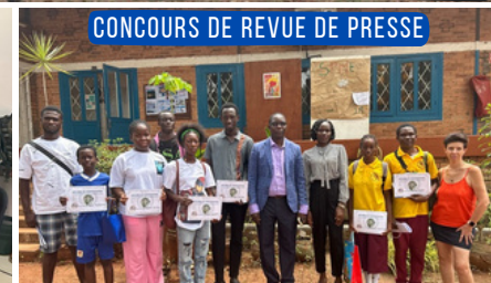
CONCOURS DE REVUE DE PRESSE