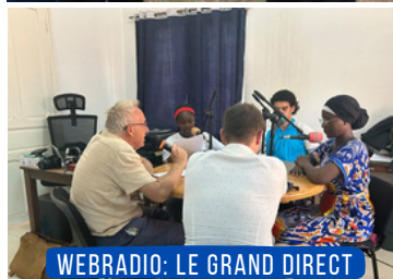
WEBRADIO: LE GRAND DIRECT