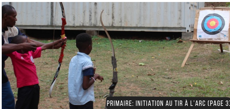
PRIMAIRE: INITIATION AU TIR À L'ARC (PAGE 3)