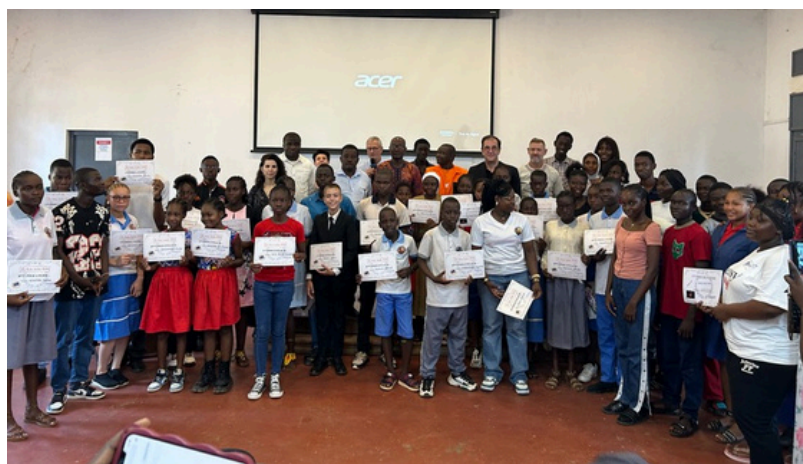
CÉRÉMONIE DE REMISE DE PRIX AUX LAURÉATS DES CONCOURS DE DICTÉE ET DE POÉSIE (PAGE 2)